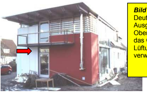
Bild 1: Deutlich zu erkennen - die Ausgangstüre und das Oberlicht. Hier im Bild wird das Oberlicht auch als Lüftungseinrichtung verwendet.

Oberlichter werden bei Türen und Fenster eingesetzt, die im oberen Bereich eine Lichtzufuhr bringen sollen. Diese Oberlichter dienen oftmals als Lüftungseinrichtungen. Dabei werden teilweise Motoren und manuelle Hebel auf Brusthöhe des Bewohners bewegt.