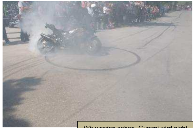
Wir werden sehen, Gummi wird nicht geschont.