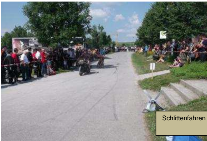
Schlittenfahren mit einem Motorrad.

Link zum Produkte-Test vom BauFachForum: http://www.baufachforum.de/index.php?Produkt-Tests