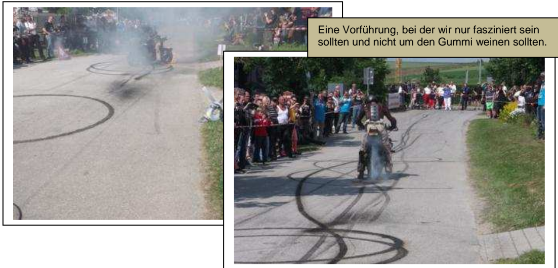
Eine Vorführung, bei der wir nur fasziniert sein sollten und nicht um den Gummi weinen sollten.