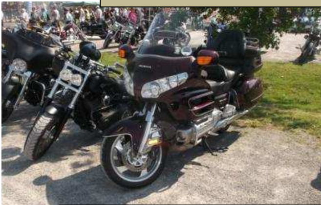
Der gediegene Motorradfahrer. Fast schon ein Hauch von Familien-Motorrad. Denn Rechts erkennen wir, dass dieses Motorrad einer Auto Armatur nicht nachsteht.