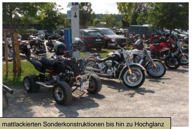
Von mattlackierten Sonderkonstruktionen bis hin zu Hochglanz Motorrädern, alles vorhanden. Halt... bin ich mit 4 Rädern auch ein Motorrad?