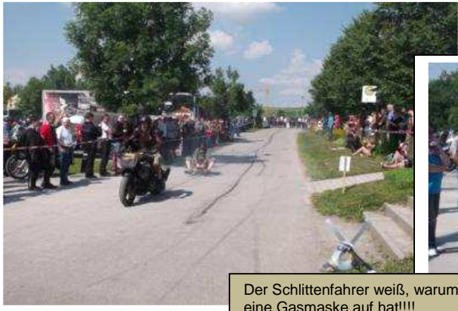
Der Schlittenfahrer weiß, warum er eine Gasmaske auf hat!!! Biker gib Gummi!!!