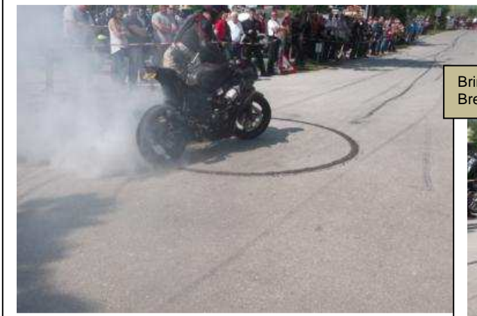
Bringt er den Teer zum Brennen?