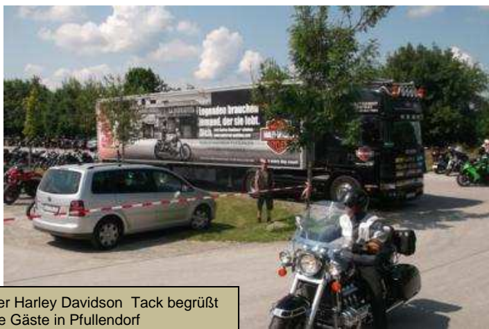
Der Harley Davidson Tack begrüßt die Gäste in Pfullendorf

Pfullendorf bebt vor der Motorrad – Serenade!!! Mozart hätte diese Serenade incl. Martinee nicht besser komponieren können.