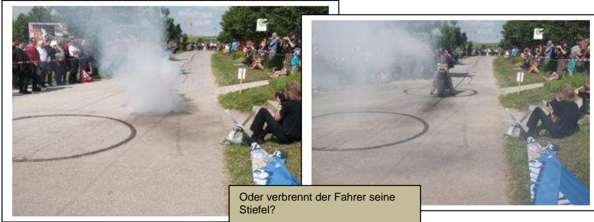
Oder verbrennt der Fahrer seine Stiefel?