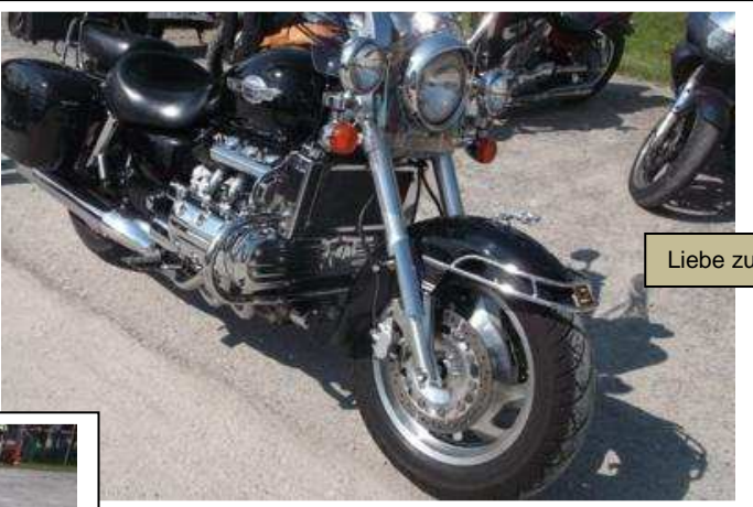
Liebe zum Detail:

Der Seepark voll in den Händen der Biker. Die Badegäste mussten dieses Wochenende abgezäunt im >Außenbereich< ihren Badefreuden frönen. Denn früh morgens gehörte das Freibad den übernachtigten Bikerinnen und Bikern vom Lagerfeuertreff des Freitags. Kompliment an die Stadt Pfullendorf.