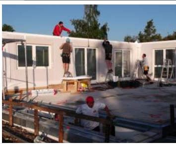
Bild links: bei einem Fertighaus stehen in der Regel die Subunternehmer in der Haftung des GU.

Subunternehmer beispielsweise eine mangelhafte Arbeit oder Schäden produziert, steht nicht der Subunternehmer in der Verantwortung, sondern der GU als Gesamtschuldner. Er kann dann gegebenenfalls im Innenverhältnis den Heizungsbauer zur Rechenschaft ziehen.