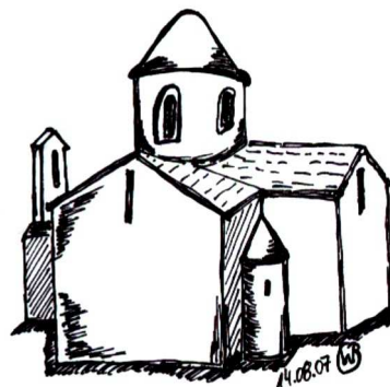
Skizze B45: Die kleinste Kathedrale in Nin (Heilig-Kreuz-Kathedrale)