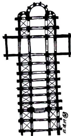
Skizze B44: Romanischer Grundriss

Als die größte Kathedrale der Welt wird der Petersdom in Rom genannt. Bestimmt strittig in der Baugröße, nicht aber von dem größten sakralen Bau der Welt.